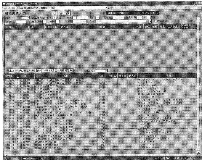
請求書入力の手間が大幅に軽減された用紙実績入力画面

その後、光和コンピューターは出版社の資材原価管理パッケージを発売したが、固い書籍が多い平凡社で使うためにはカスタマイズも必要だった。