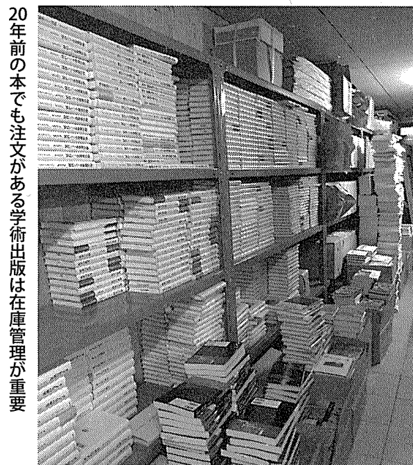
20年前の本でも注文がある学術出版は在庫管理が重要

ました」(原部長)という。実際に取次請求の伝票は、それまで全てドットプリンターを使って複写を取っていたが、光和コンピューターのアドバイスで控えをなくし、リストでチェックする方法に変更。これにより手間も伝票の枚数も減らすことができた。