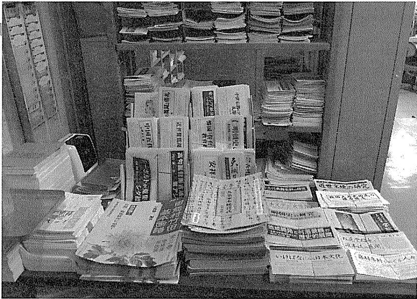
多くのチラシから顧客に合わせてDMを行う

また、多くの出版社でシステム導入の実績があるため、「他の出版社がどのようにしているのかを、光和コンピューターを通して知ることもでき