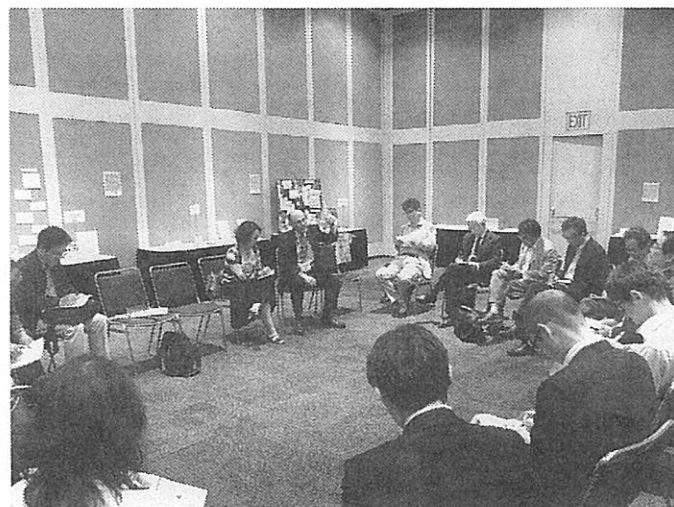
アメリカ書店組合 (ABA) とのミーティング