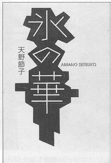
左から『水の華』の自費出版版、幻冬舎の単行本、幻冬舎文庫