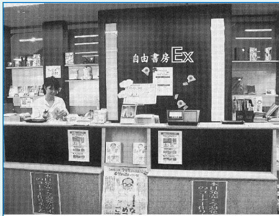
自由書房 EX 高島屋店 レジ

岐阜市に本拠をおく自由書房は、2017年3月に光和コンピューターの小型低価格のPOSシステム「KPOSmini」を、EX高島屋店とブックセンター鷺山店の2店舗に導入。導入人にあたっては担当者が埼玉県の導入書店を視察したというが、導入後は店舗スタッフからも好評だという。