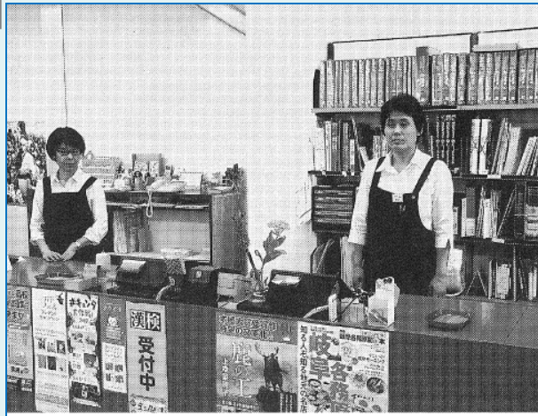
自由書房ブックセンター鷺山店 レジ