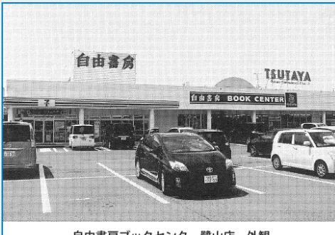
自由書房ブックセンター鷺山店 外観