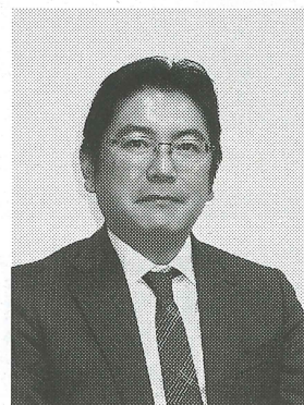
2016 年に就任した筑紫社長

導入したのは販売管理、印税・支払管理、製作・原価管理のシステム。当初は 2015 年 4 月の稼働を予定していたが、要件定義・開発に時間がかかったこと、採用品が多い 3、4 月を避けたことで 2016 年 5 月に新旧システムの平行稼働を行い、6 月に本稼働した。2016 年に就任した筑紫社長