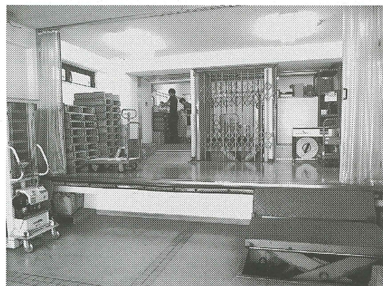
本社の 1 階が商品の出荷場になっている

在庫保管や入出庫は本社 2、3 階のスペースと、近隣の自社倉庫で行っている。営業部の社員 6 人が、入出荷や返品処理などの業務も担当しているが、新システムを導入したことで在庫数の精度が向上したという。