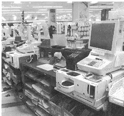
レジカウンター3カ所11台のうち9台に自動釣銭機を設置

自動釣銭機は2018年4月、POSレジ(光和コンピューターのK-POS)の入れ替えに合わせて、本と文具、CD売場の4カ所のカウンターに11台あるレジのうち、CDやサービスカウンターを除く9台のPOSレジに設置。くまざわ書店グループとして初の導入となった。