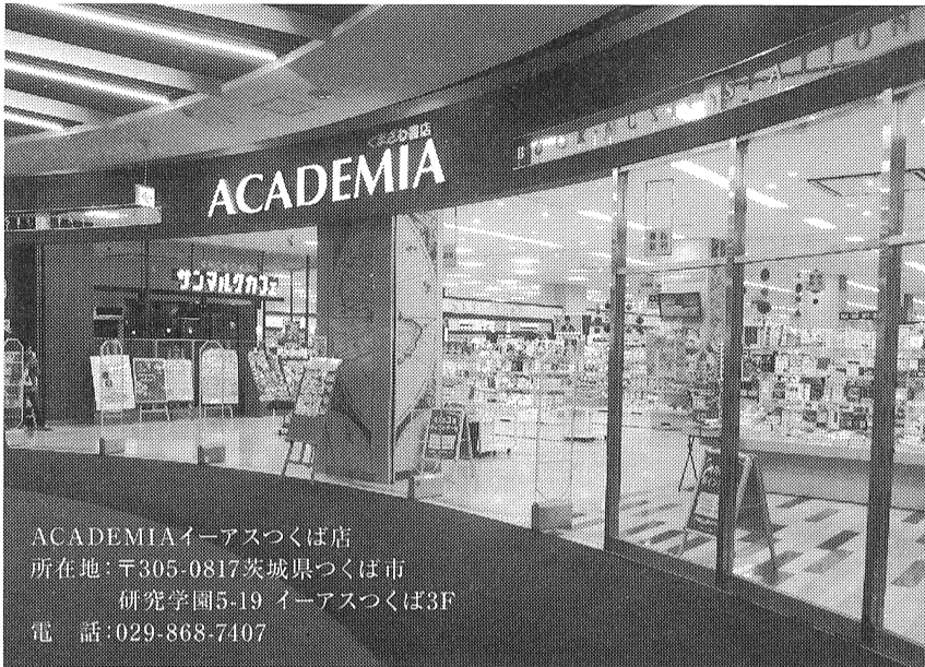
ACADEMIAイーアスつくば店 所在地:〒305-0817茨城県つくば市 研究学園5-19 イーアスつくば3F 電話:029-868-7407

くまざわ書店のACADEMIAイーアスつくば店は、2018年4月に自動釣銭機を導入したが、精算業務が30分ほど短縮されるなど生産性を向上する効果を発揮しているという。同書店では同店舗を皮切りに順次、各店舗に自動釣銭機を導入している。