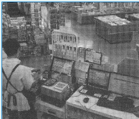
レジカウンターは店内に1カ所