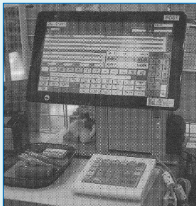
低価格、省スペースの「KPOSmini」