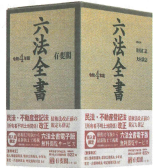
『令和4年版 六法全書』

現在の年間新刊発行点数は180タイトルほど。稼働点数は約2000タイトル。主な4分野の点数比率は法律が53%、経済・経営が25%、人文・社会が17%、政治が5%。金額的には7割ほどを占める法律が圧倒的だ。