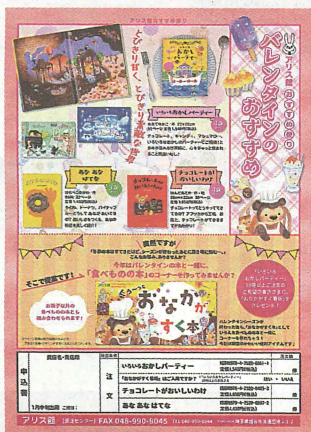
書店が必要とする情報を盛り込んで郵送している販促チラシ