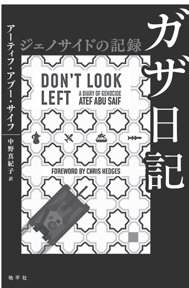
5月に刊行しすでに重版した『ガザ日記』

販売促進は、加盟する版元ドットコム of 書店ファックス DMと主要書店への訪問営業とオンラインブックストアだ。流通はトーハン、日本出版販売、楽天ブックスネットワーク、そして小規模書店に強い八木書店に口座を持つほか、直接取引にも対応する