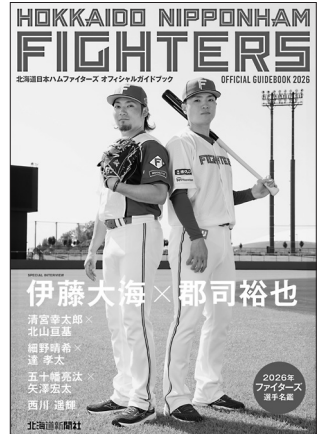
『北海道日本ハムファイターズ オフィシャルガイドブック 2026』