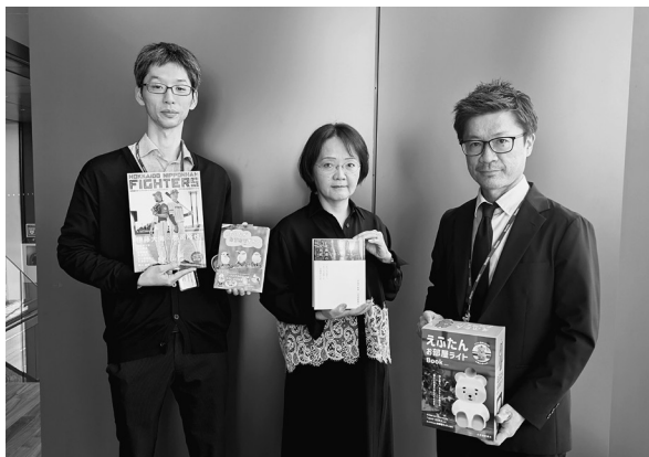
左から太田氏、大塚氏、水島氏

とで、それまで目視で確認して手入力していた返品処理や棚卸の作業が大幅に軽減され、登録漏れなどもなくなった。