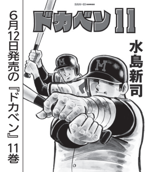
6月12日発売の『ドカベン』11巻

また、読み込みエラー表示からの修正を容易にするなど、光和コンピューターが同社や他出版社からのリクエストを受けてシステムのバージョンアップを実施した。「かなり協力していただき、快適に利用できています」と宝示戸氏は高く評価している。